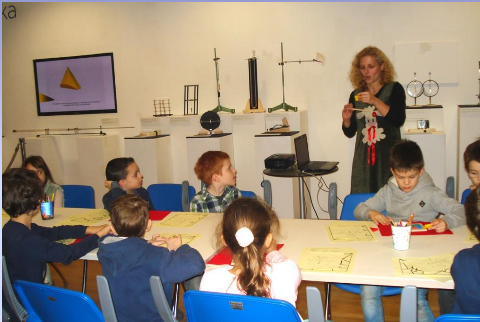
Radionica Božićna priča u tangramima , uz izložbu Želim znati!